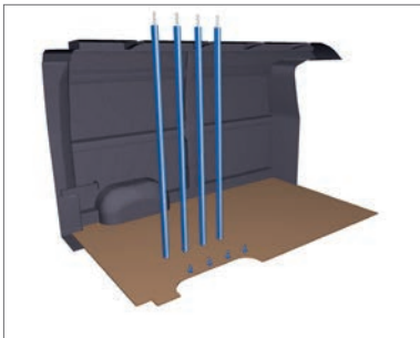
Spannstangen (4 Stk.) zur Ladungssicherung inkl. Airlineschienen für Vivaro.

Bei Kauf eines Opel Vivaro / Movano schenken wir Ihnen einen der folgenden Umbauten/Pakete.