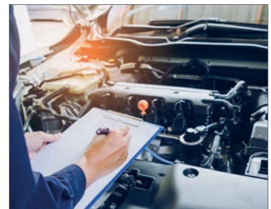
Inspektionspaket: 2 Inspektionen + 1x TÜV für Opel Vivaro / Movano

Bei Kauf eines der genannten Fahrzeuge ist jeweils einer der oben genannten Optionen inklusive. Darin enthalten sind Erwerb und Montage bei uns im Elspass Autoland. Das Inspektionspaket umfasst 100% Material + 100% Montage nach Herstellervorgaben.