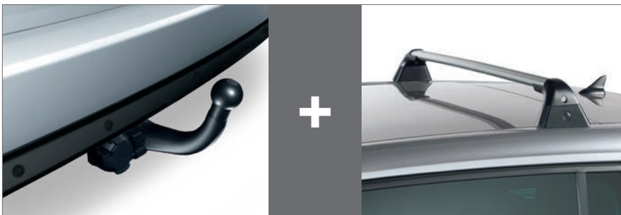
Anhängerkupplung und Dachträger für Opel Vivaro Zulässige Anhängerlast: 2t Vivaro Dachlast: 200kg