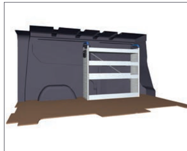
Regaleinbau von der Firma Sortimo für Vivaro. 381 x 1246 mm